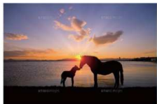
干支とんど(午)の馬と大馬

令和 8年 干支とんど(午 うま) 制作日：2025年 10月26日(日)、11月2日(日)、3日(祝)